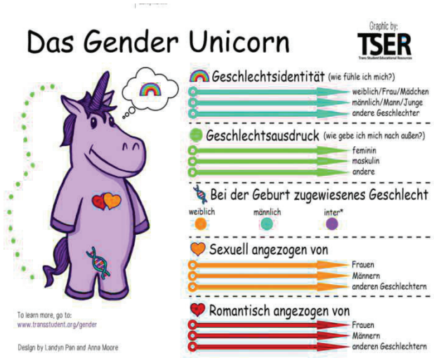
Resim 2: Gender Unicorn

süreçlerini anlatan bir belgesel olup ergen çocuklardan biri de Sinan isimli bir Türk çocuktur (hedef kitlesi +10). Üçüncüsü, ilkokul çocuklarının cinsel ve cinsiyet yönelimlerini bulmalarını kolaylaştırmak üzere hazırlanmış tek boynuzlu at görselidir. Bu görselde kişinin cinsel kimlik, cinsel dışı vurum, doğumda atanmış cinsiyet, cinsel yönelim ve romantik yönelim olmak üzere kendini beş ayrı başlıkta değerlendirmesi beklenir (Bkz. Resim 2).