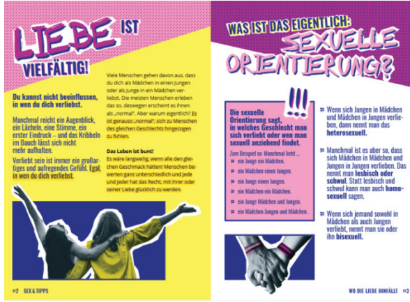
Resim 1: Sex'n'tips Broşürü

trans bireyler hakkında bilgiler verilir. Kime Aşık Olunur 23 isimli ikinci broşürde, gençlerin kime isterlerse aşık olabilecekleri ifade edilerek cinsel yönelim, lezbiyen ve gay kavramları açıklanır. Danışmanlık ve Yardım 24 isimli broşürde; cinsel yönelim, inter ve trans kavramları tanımlanır. Son iki broşürde, farklı yönelimleri olan gençlerin yardım alabilecekleri kurumların bilgileri verilir.