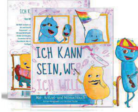
Resim 5: Ich kann sein, wer ich will

Patatese benzeyen cinsiyetsiz bir karakterin hikâye, boyama ve aktivite kitabıdır (+5 yaş). Satışa sunulan bu kitaba ücretsiz erişim yoktur. Kapağında ve örnek iç sayfalarında farklı LGBT bayraklarının yer alması ve patatesin farklı cinsel kimliklerle resmedilmesi, materyalin doğrudan bir LGBT kaynağı olduğunu gösterir (Bkz. Resim 5).