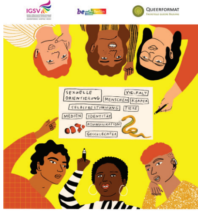
Resim 4: Biodivers, Biyoloji Kitabı

Roman ve belgeselin derste kullanımını kolaylaştırmak amacıyla hazırlanan alıştırma kitapçıklarında, öğrencilerden LGBT bireylerle empati kurmaları, dışlanmamaları için neler yapmak gerektiği üzerine refleksif şekilde düşünmeleri ve hikâyelerin kahramanlarına mektup yazmaları istenir. Ders kitaplarındaki alıştırmalarda öğrencilerden; kız ve erkek ayrımının olmadığı, cinsiyet zamirlerinin kullanılmadığı cinsiyetsiz okul fikri hakkında tartışmaları talep edilir. Kimlik kartlarında cinsiyet ibaresinin yer alması, bebeklere belirli bir cinsiyete göre davranılması ya da iletişim araçlarının, heteronormatif stereotipleri güçlendirmesi ise yine üzerinde eleştirel bir şekilde düşünülmesi istenilen konular arasındadır.