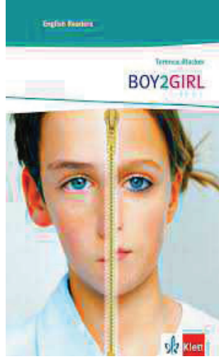
Resim 7: Boy2Girl

için, okulun ilk haftasında kız gibi giyinmek zorunda kalışı anlatılır. İkinci kitap, babalarının gay olduğunu öğrenen iki kardeş hakkındadır 39 (Bkz. Resim 7).